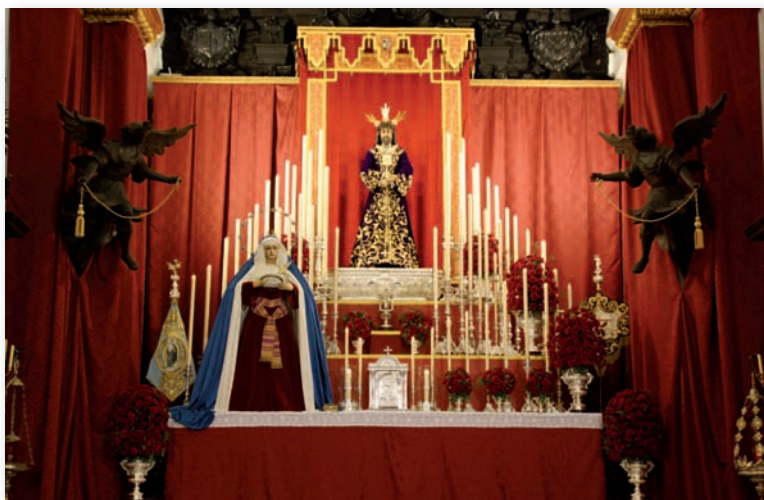
Quinario. Febrero 2013