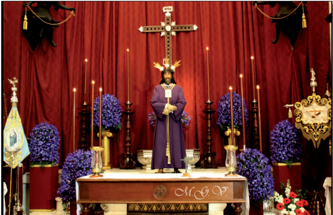
Besapié. Marzo 2013