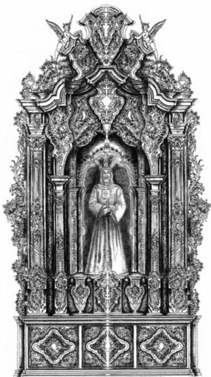
Proyecto de Nuevo Altar para Ntro. Padre Jesús Cautivo. Con tu ayuda será una realidad.