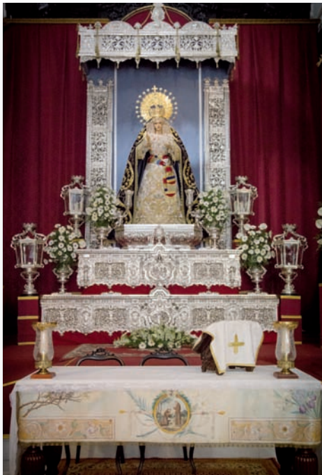
Triduo a M. a Stma. de la Estrella. Agosto 2013