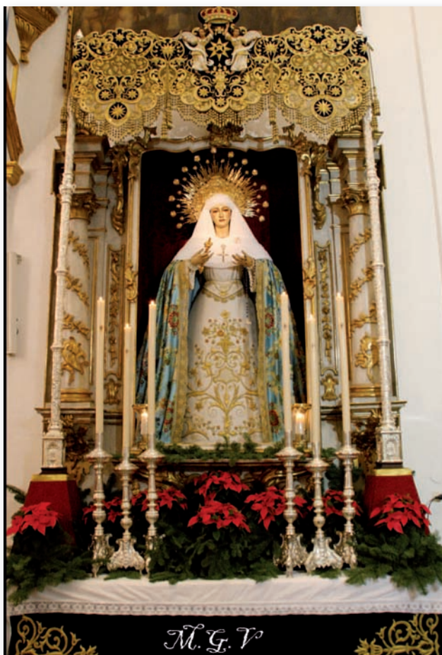
Inmaculada. Diciembre 2013